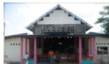
Het nieuwe multifunctionele gebouw in Tonjong

In het afgelopen jaar is hard gewerkt aan de bouw van het multifunctionele gebouw, wat bestaat uit een aula, klaslokalen, kantoor en gastenkamers voor vrijwilligers.