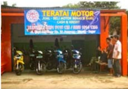
De nieuwe Showroom

Begin januari 2011 werd, mede dankzij een donatie van een van onze sponsors, een eigen showroom ruimte geopend.