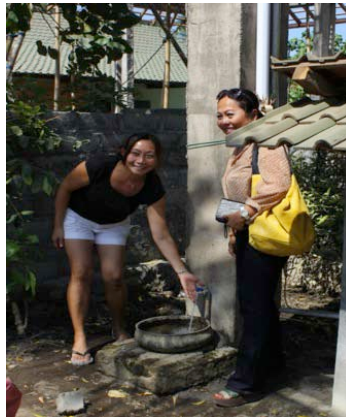
schoon stromend water