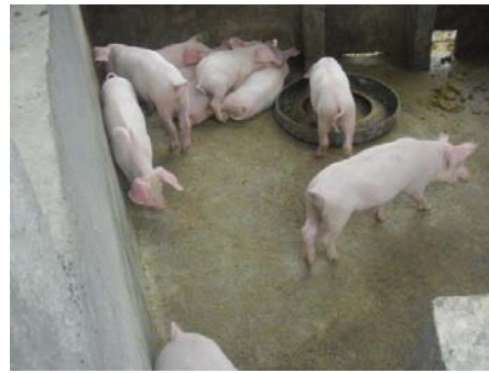
1 e varkensfokkerij