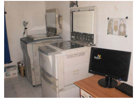
2 o kopieermachine

In maart 2011 is de photocopy shop en internet cafe geopend. In juni 2012 is een tweede kopieermachine aangeschaft, zodat meer drukwerk opdrachten aangenomen kunnen worden.